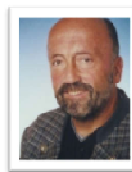
Klaus Wolfmann Olympia-Sieger 1972 Coach, Sportlehrer und Unternehmer